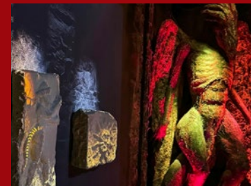
Muzea i atrakcje dla dzieci

KARKONOSZE I GÓRY IZERSKIE atrakcje turystyczne 2026 Kowary · Szklarska Poręba · Karpacz · Jelenia Góra · Świeradów Zdrój