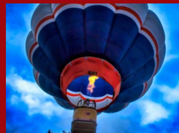
Przygoda i wypoczynek