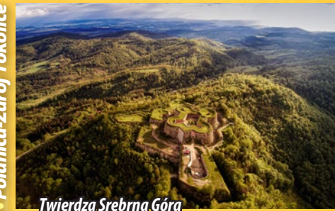
Twierdza Srebrna Góra

Kłodzko - Stronie Śląskie - Złoty Stok - Kudowa-Zdrój - Polanica-Zdrój i okolice