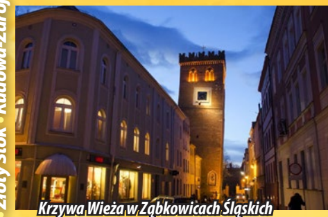
Krzywa Wieża w Ząbkowicach Śląskich